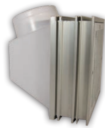
Filtros caja de difusor