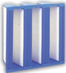
Filtros de Bolsas rígido